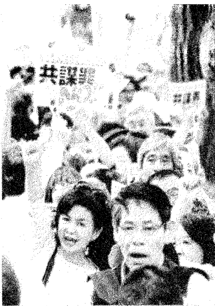
(写真) 「共謀罪は絶対廃案」と声を上げる人たち=6日、衆院第2議員会館前