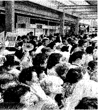
(写真) 志位和夫委員長の訴えを聞く人たち 7月27日、東京都葛飾区