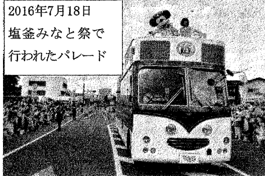
2016年7月18日 塩釜みなと祭で 行われたパレード