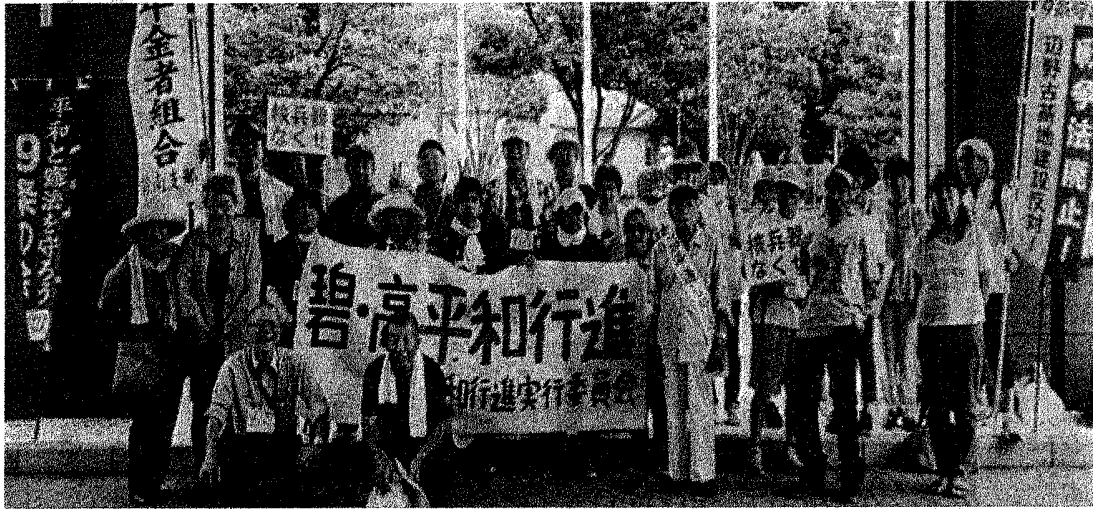
へきなん・高浜網の目平和行進の参加者。猛暑の中、碧南市役所から、名鉄三河高浜のいきいき広場まで元気に歩きました。(7月9日碧南市役所)