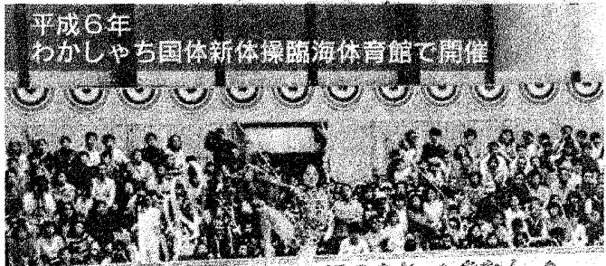
平成6年わかしやち国体新体操臨海体育館で開催 「新体操のまち」と呼ばれた碧南市。地元選手の応援に会場に入りきれないほどの人がかけつけました。

碧南市では、平成6年わかしやち国体の新体操を臨海体育館で開催し、これを契機に市内で新体操教室やクラブが発足しました。しかし、現在は市も投げやりで、「新体操のまち」と言っていたころと比べると面影もありません。「市のご都合主義で、ビーチバレーを推進してもやがて時がたてば閉古鳥が鳴くようになるのでは」という市民の声も上がっています。