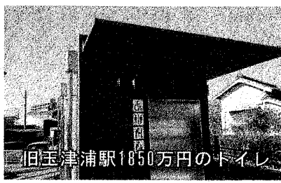
旧玉津浦駅1850万円のトイレ