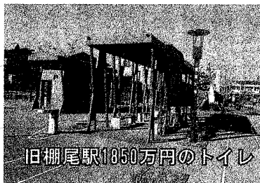
旧棚尾駅1850万円のトイレ

三河旭駅整備に2億2487万円 名鉄廃線跡地を3億円で購入し、総額15億円で整備している「レールパーク」 8月2日入札で、最終工事の三河旭駅前後の工事費用が、2億2487万4360円となりました。散歩にわずかな人が利用している程度ですが、旧玉津浦駅、旧棚尾駅トイレはどちらも1850万円かけました。 日3千人以上利用の北新川駅に障がい者トイレなし 一方、一日3千人以上