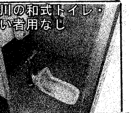
北新川の和式トイレ。障がい者用なし

上が使う北新川駅は、駅構内に和式トイレがあるだけです。障がい者の人も、駅の外からも利用できません。