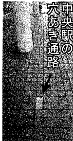
中央駅の狭い通路