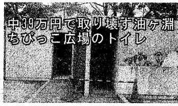
中39万円で取り壊す油ヶ淵ちびっこ広場のトイレ