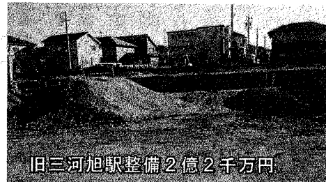
旧三河旭駅整備 2億2千万円