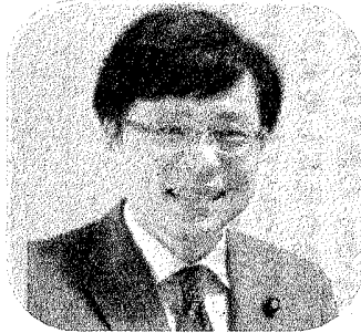
参議院議員 井上さとし