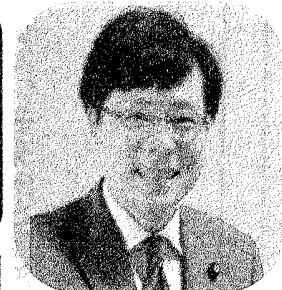
参議院議員 井上さとし