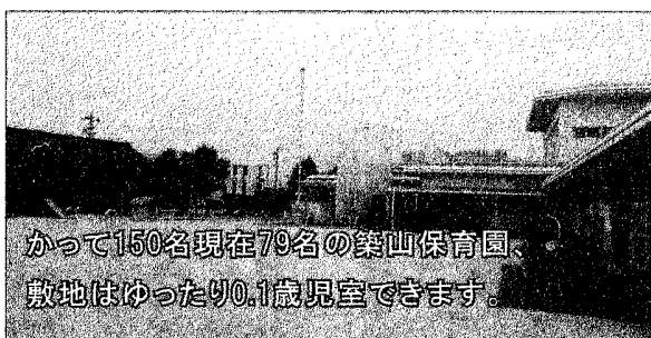
かつて150名現在79名の築山保育園、敷地はゆったり0.1歳児室できます。