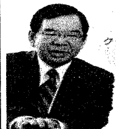
クラシックが趣味！

党の代表は、2〜3年ごとにひらく党大会で選ばれます。全国の支部から代議員が集まり、方針を話し合うとともに、選挙で党指導部を選びます。現在の委員長は、志位和夫です（2000年から）。