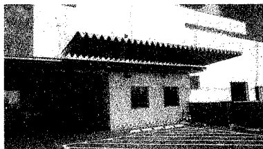
H30.7月に251万5320円で、設置されたあいくる2階の新しい庇

ねぎた市政のゆがみ露呈 11月12日議会全員協議会で、福祉センターあいくるの2階駐車場屋根の設置と撤去に関して不正があり、3部長・課長・補佐など9名の職員に減給、戒告の処分をしたことを市当局が報告しました。 建築確認なしの違法建築 あいくるは、市の施設を社会福祉協議会に指定管理で維持管理をさせています。もともと、旧保健所後で、駐車場も狭く、日本共産党は、改築に対して近隣地の取得や、新川幼稚園南側の「職業訓練所」跡への変更を提案していました。しかし執行部は聞く耳をもたず強行。2階を主に障がい者が利用するために、市内公共施設で初めて2階に駐車場を設置しました。利用者から、車の乗降時、雨に濡れると雨よけの設置が要望されました。