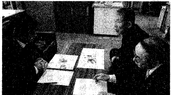
豊田市 TOYOTA CITY