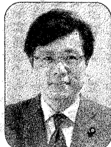
参議院議員 井上さとし