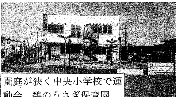
園庭が狭く中央小学校で運動会。碧のうさぎ保育園

答 碧のうさぎは90人定員で57人の申し込み。子ども園は第2へきなんの幼稚園コース3人。へきなん園は11人。公立保育園は羽久手63人、築山96人、天道106人で、5園で137人定員割となり、4月から公立園85人の定員削減を行う。兄弟別別は10戸23人。児童クラブは127人定員オーバー。《裏面につづく》