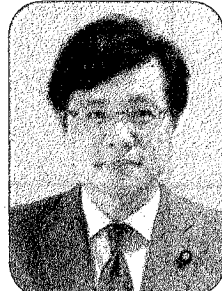
井上さとし 参議院議員