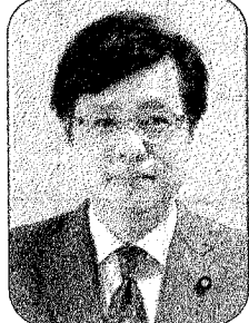
井上さとし 参議院議員