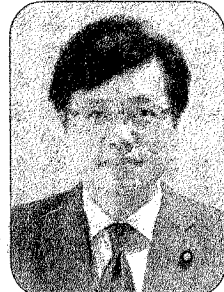
参議院議員 井上さとし