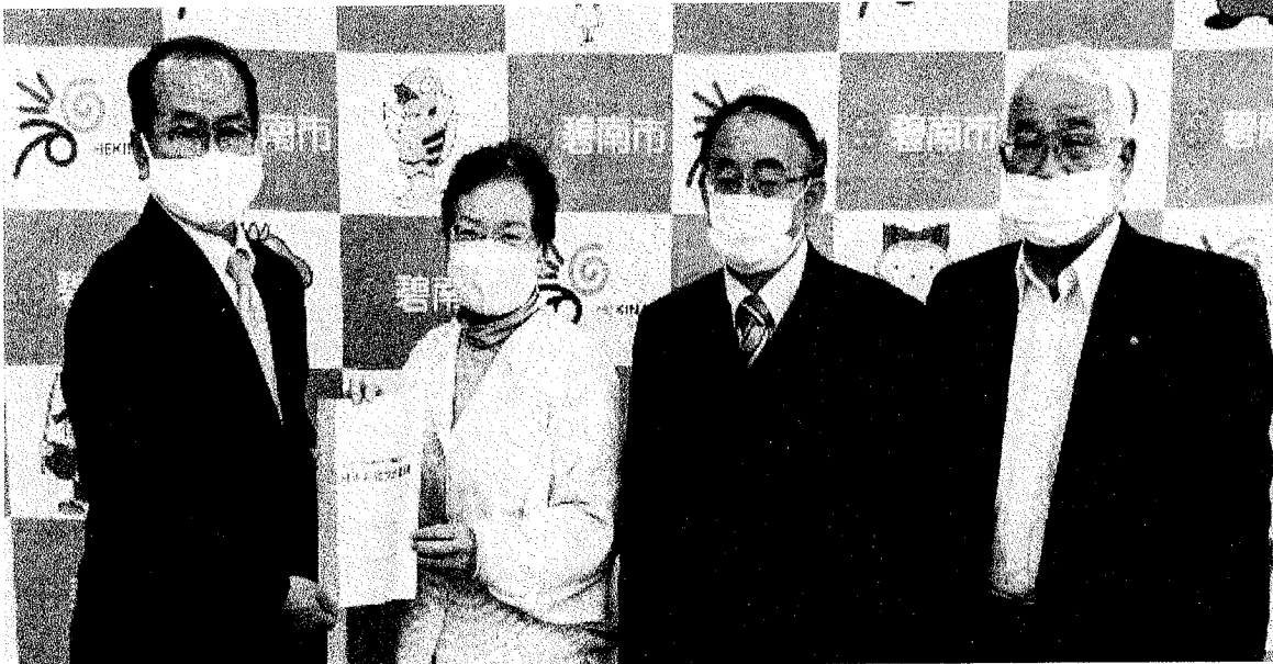
碧南市長 禰宜田 政信 様 2020年11月9日