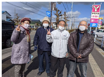
19行動で「条約批准」の署名を呼びかけ1/19

95・88%が実施している非核自治体宣言も碧南市は行っていません。ねぎた市長はヒバクシャ署名も政府への批准の要求もしていません。市民の反核平和の世論で市も国も変えましょ