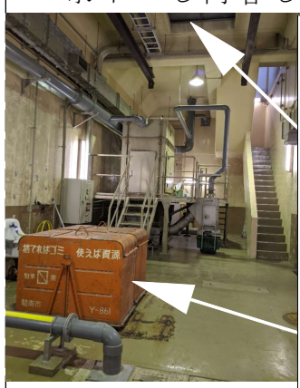
落下した開口部とダストボックス

作業内容改善を 日本共産党山口、岡本両議員は15日現地視察を行いました。下水汚水を蜷川対岸に送る施設で、月1回委託業者が集塵筒所の袋（微量）を交換し年に1回、地下施設内のダストボックス2個をクレーンで6mつり上げ改修していました。機械修繕用の開口部から落下したのです。月ごとに屋外にダストボックスを移動すれば危険なクレーン作業は回避できた。と部課長に作業工程の見直しを求めました。