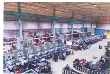
一貫生産体制の現場ライン

図面作成から試作、金型製造、プレス、溶接、機械加工までを一貫して自社で効率的に対応している。中でも注目すべき技術として、①高性能サーボプレスの持つ機能をフル活用し、従来のプレス機では加工不能である複雑な形状を実現。②さらにプレス工程数削減・金型負担軽減による破損抑制で、低コスト・短納期を実現。③独自の生産管理システムによるラインバランシングやボトルネックの解消などで生産性を常に効率化させている。