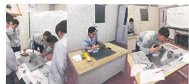
若手社員の検査器具教育風景

独自の研修プログラムにより、製造業未経験者でも1年かけてプロのエンジニアに育成している。若手社員でも様々な部署を経験させ、責任ある仕事を任せることでやりがいを醸成し、多能工の育成に繋げている。男女変わりなく育成を行うので、プレス・溶接の業界では、女性比率が高い企業である。また社員の平均年齢は28歳、20代までの若手社員が全社員の約7割を占めている。勤務時間や休暇取得に柔軟に対応する勤務体系導入で子育て女性や60歳以上のシルバー人材、障害者雇用も積極的に行っている。