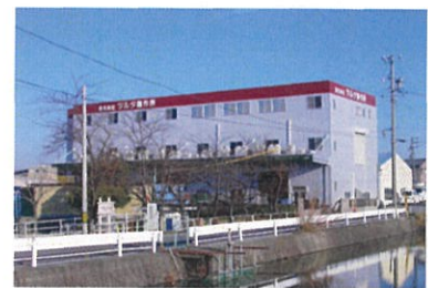
本社刈谷工場概観

当社の位置する愛知県西三河地域は、トヨタ自動車(株)をはじめとする製造業が集積する地域である。この環境の中で、当社は厚板プレス加工と複雑3次元形状のプレス加工、高精度の溶接を得意とし、トヨタグループ企業を取引先として、自動車・福祉車両・産業車両(フォークリフト)の部品を主に独自の技術で製造している。特に、福祉車両のリフトアップシートユニット製造や、フォークリフト車体フレームの25mm厚板プレス加工・溶接は、国内では他の追従を許さない技術である。