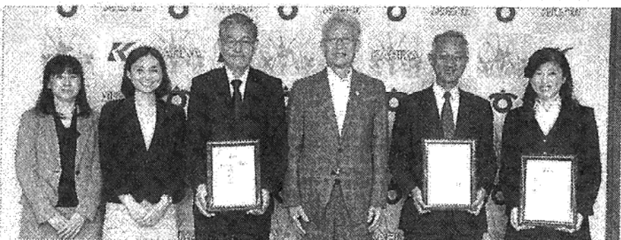
刈谷市役所で開かれた認定証授与式

【刈谷】刈谷市は30日、女性活躍推進に積極的に取り組んでいる市内3事業者を「刈谷市ハーモニーカンパニー」として認定した。