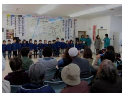
高浜幼稚園児合唱