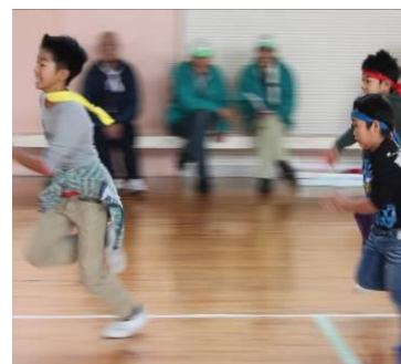
町内会対抗リレー

各町内会代表選手の皆さんの大迫力な走りと声援の中で、白熱した競争が繰り広げられました。