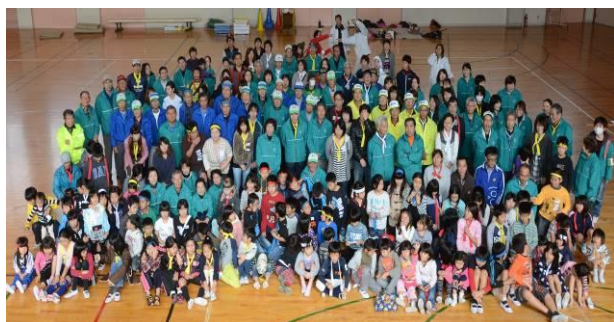
参加者 213人 勢ぞろい