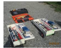
防災倉庫の中も 点検しました