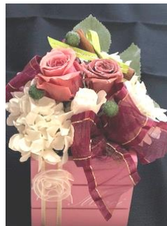
イメージ 花材の変更あり