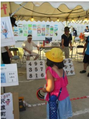
沢渡町のお店 (輪なげ)

「高浜まち協 夏まつり」を8月5日（日）高浜小学校グラウンドで開催しました。今年は高浜小学校の工事の関係で、例年より少し会場が狭く、ご不便をおかけしましたが、人の輪がせばまった分、かえって賑わい、盛り上がりました。浴衣姿の方も多く、あっといふ間の活気ある夏の夜のひと時だったのではないのでしょうか。これも、厳しい暑さの中、準備・運営していただいたまち協会員・夏まつり実行委員、町内会、PTA、子ども会などのスタッフの皆様、高小5年生の皆さんののおかげです。お疲れ様でした。ご協賛いただきました皆様、ご来場の皆様、ありがとうございました。