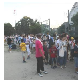
抽選うちわ配布 (長い列ができました)