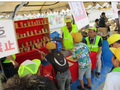
稗田町のお店 (射的・アイスビーナイン)