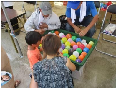
青木町のお店(風船つり)