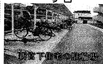
新宮下住宅の駐輪場

を。運転業務の3年毎入札をやめ、若い人も働ける安定雇用を市が保障すべき。 ◎ 今後、拡充を検討せざるを得ないと考える。9月の入札は実施する。