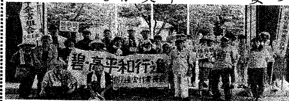
7月9日の平和行進。国連122カ国の賛成で核兵器禁止条約が。草の根の力で世界が動きました。日本政府も賛成すべき

◇宮下住宅の1期工事が完了。1階の各戸庭が狭すぎる。駐輪場は自転車かわりかな風で転倒する設計不備。早急な改修と次期工事に生かすよう。 ◎ 駐輪場は、対策をとる。