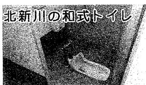
北新川の和式トイレ