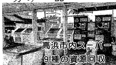
高浜市内スーパー 9種の資源回収