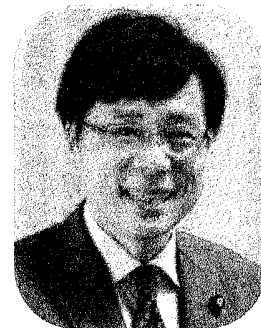
参議院議員 井上さとし