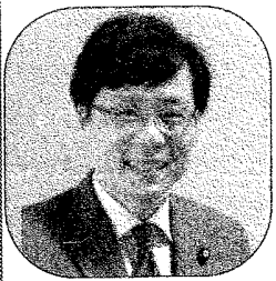
参議院議員 井上さとし

カシノ法、働きかた改悪を強行採決。憲法改悪の政治を、日本共産党の躍進で変えましょう