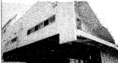
園庭なしの「空のうさぎ保育園」刈谷市築地町2丁目26番地5。社会福祉法人「一雅会」

平成29年4月に開所した、この保育園は、敷地、延床面積が碧南市に予定しているものとほぼ同じです。しかし、