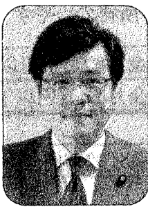
参議院議員 井上さとし