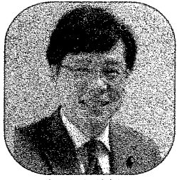
参議院議員 井上さとし