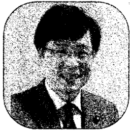
参議院議員 井上さとし