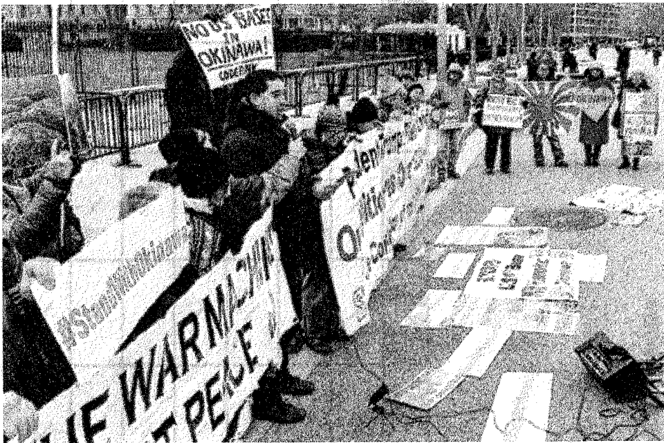
ホワイトハウス前で辺野古埋め立ての停止を訴える米市民ら＝7日、ワシントン