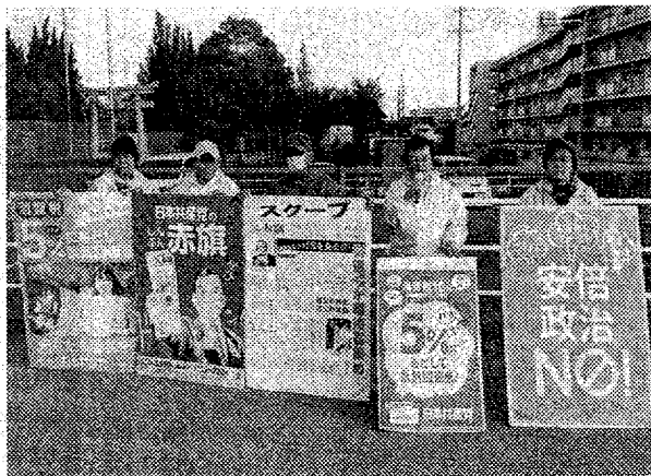
金山住宅前で宣伝 11/16

議員が、金山住宅前、ドミール、ヤマナカ前で演説。すれちがう人たちが「共産党が頑張ってるね」と笑顔のご支援をいただきました。日本共産党を大きくして野党連合政府をつくりましょ