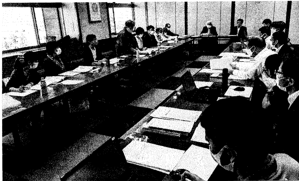
愛知自治体キャラバンで福祉や教育の制度の拡充を求める参加者 向こう正面は、正副議長。10月21日午後3時～4時市役所4階