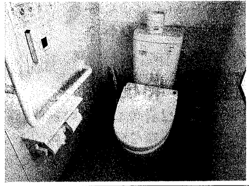
藤田医科大学病院の個室トイレ 壁面仕切りのみでドアなしです。