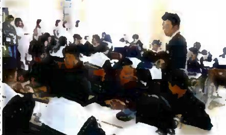
道徳の一斉授業公開