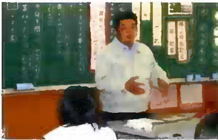
地域のゲストを招いた授業研究