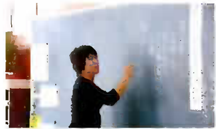
自主題材を取り入れた授業

行事や総学と連携した単元構想 外部講師を招聘した授業研究による道徳的実践力の育成 合同授業や学年授業を可能にした一斉道徳授業の位置づけ