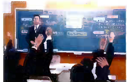
現代化の計画の沿った授業研究

地域の行事と連動した単元構成 学習内容の重点化や精選 町内を学習の場とした体験的学習の充実