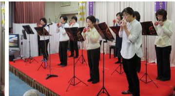
オカリナ演奏(ルビーの会)