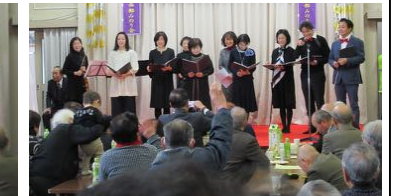
G&Oメディカルビレッジ