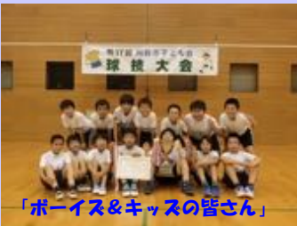
「ボーイズ&キッズの皆さん」

平成30年6月17日、第17回刈谷市子ども会球技(ドッジボール)大会において、泉田チーム(ボーイズ)が優勝を果たしました。また、キッズも3位に入賞！！9月1日(土)西三河大会に出場決定！！