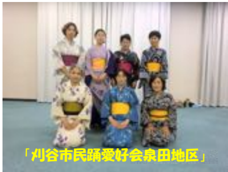
「刈谷市民踊愛好会泉田地区」