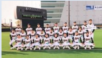
日本少年野球春季全国大会に出場

今後の泉田公民館行事は、①敬老会(9/9)②文化展(10/7)③芸能音楽発表会(1/27)と目白押し。どんどん参加して楽しみましょう。場所は何れも泉田市民館です。お待ちしております。