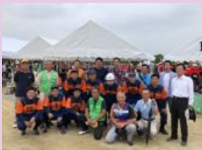
操法競技を終えて奮闘を語え合う

平成30年6月10日(日)刈谷市総合運動公園で第35回刈谷市消防操法競技会が行なわれました。消防団員の皆さんは、この日を目指して早朝や休日など練習に励んでこられました。15分団は、11位と奮闘しましたが入賞ならず！