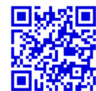
泉田自治会 ホームページ QRコード