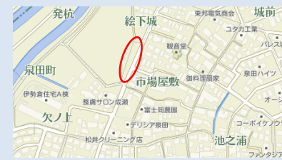
あじさいロード地図(赤丸箇所)