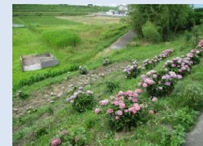
6月見頃となった「あじさい」