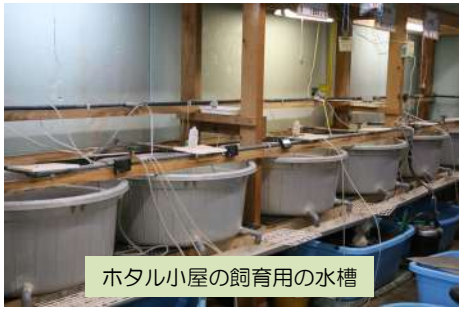
ホタル小屋の飼育用の水槽

まだ一度もいったことのない方、来年の初夏、ぜひ一度「逢妻の郷」へ。夜に舞う幻想的な光で乱舞する「ホタル観賞」に出掛けてみては如何でしょうか。光り輝く「ホタルのおじさん」にも逢えるかも・・・。