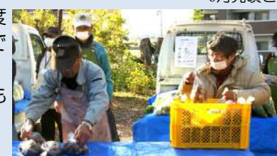
ご夫婦揃って「朝市」の出店作業