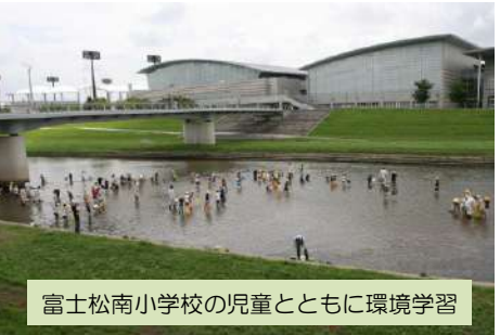
富士松南小学校の児童とともに環境学習