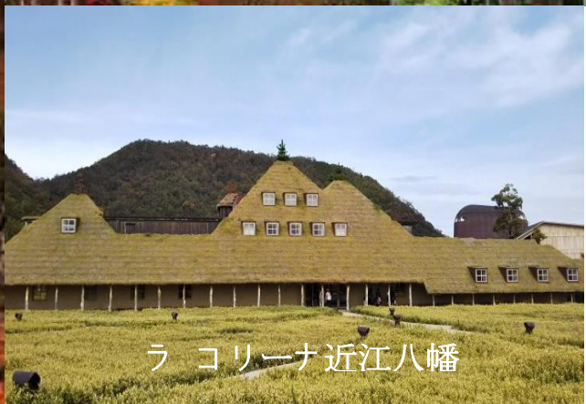
ラ コリーナ近江八幡