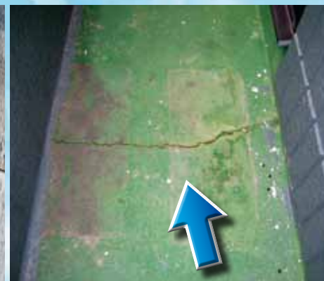
ベランダ床にひび割れがある

雨漏りを止めるまでの流れ ※雨漏り現地調査・検査・診断はNPO法人雨漏り診断士協会認定の雨漏り診断士がお伺いします。