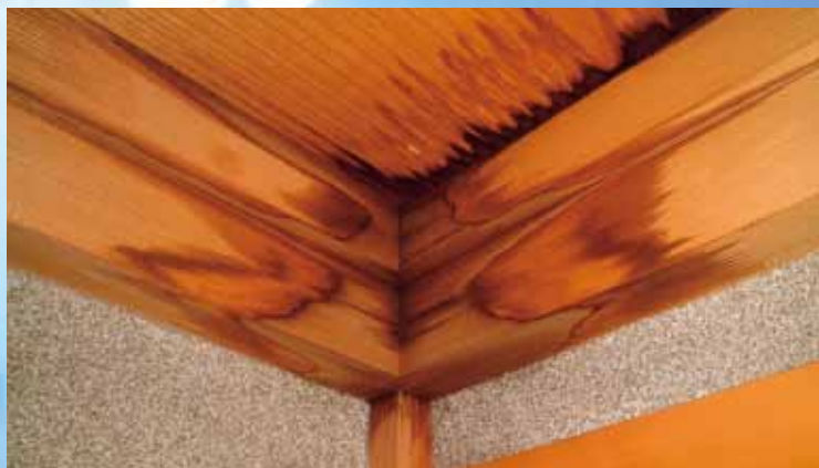
美しい和室もこうなったら台無しです

雨漏りは人間が癌や虫菌にかかったときと同じように、じわじわと建物をむしばんでいきます。 早期発見、早期治療 がいちばん大事です。