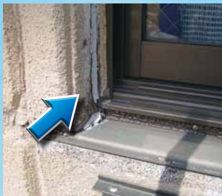
サッシ廻りのシーリングが劣化している