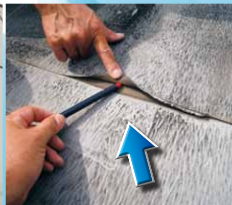
シート防水のつなぎ目が剥がれている