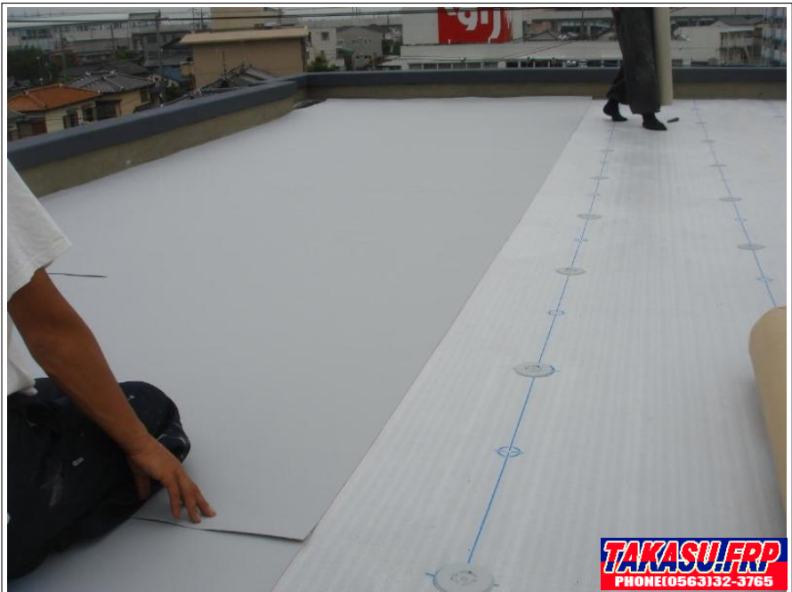
塩ビシート敷き込み