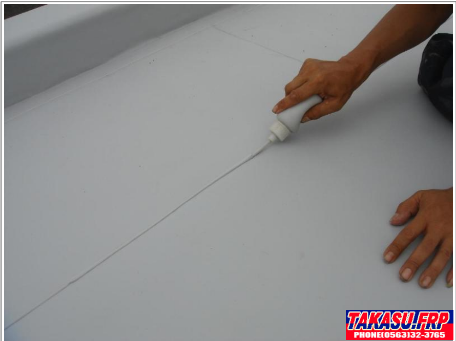
塩ビシートジョイントシール