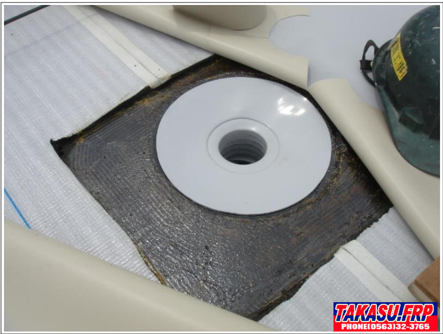
二重ドレン取り付け