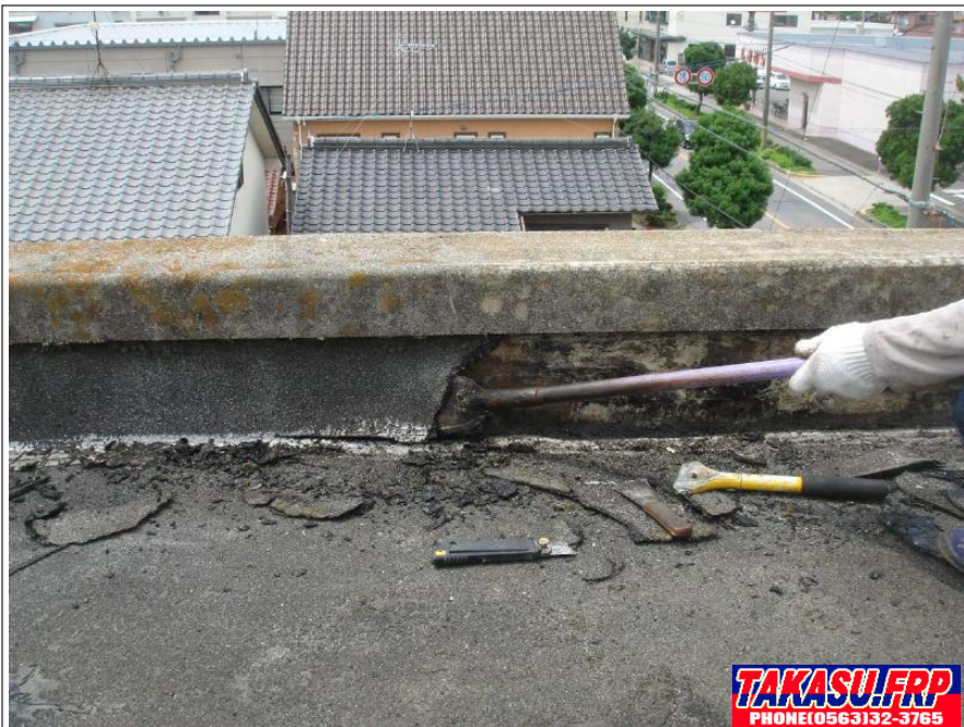
既存立面防水撤去