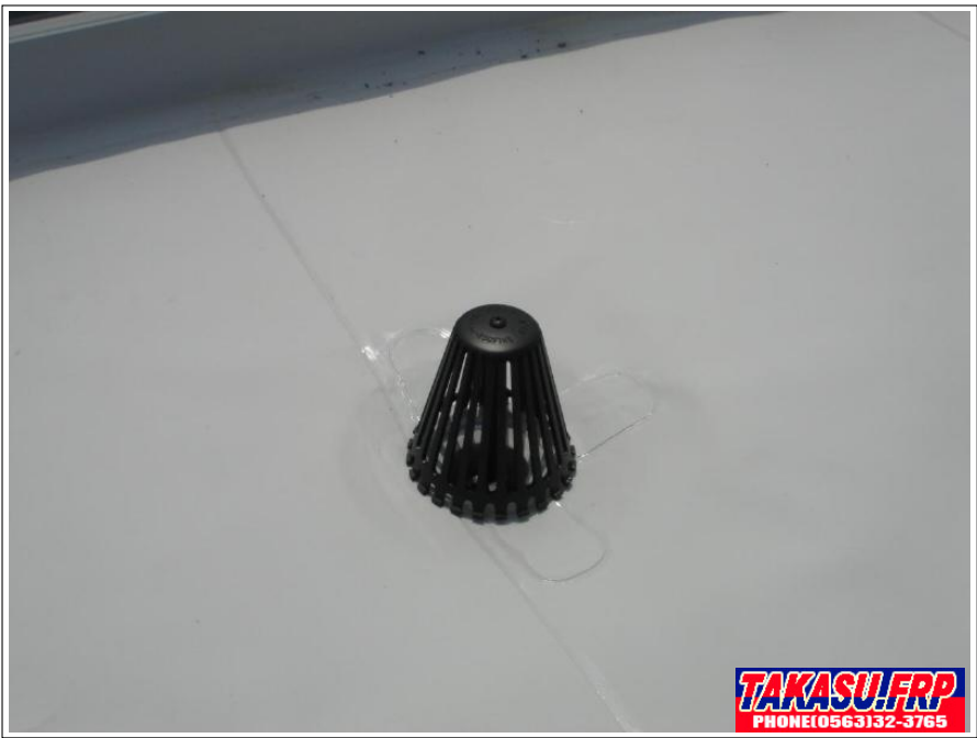
ドレンキャップ取り付け