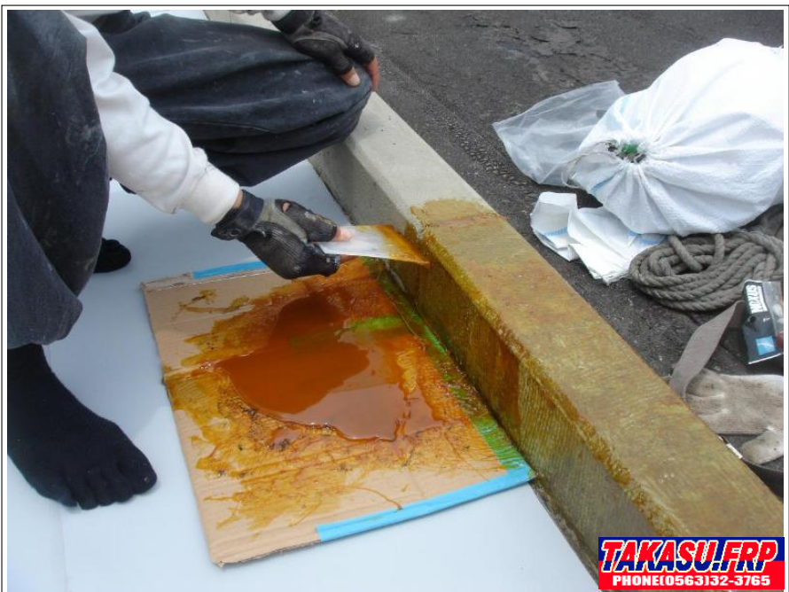
立面部 接着剤塗布