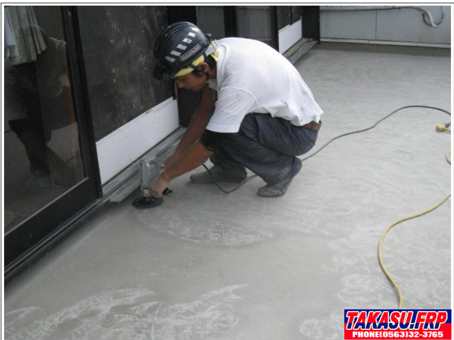
サンディング処理