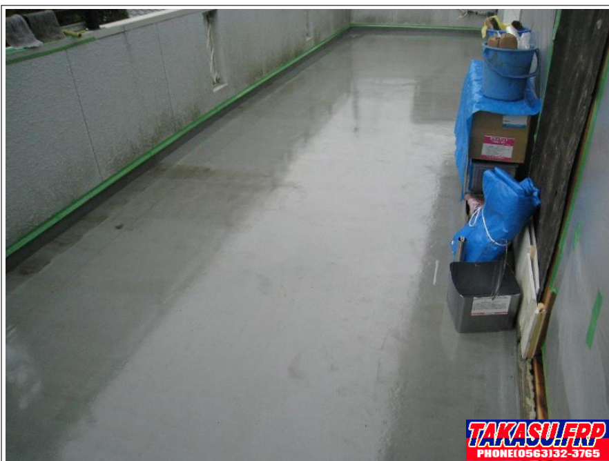
FRPプライマー塗布 完了