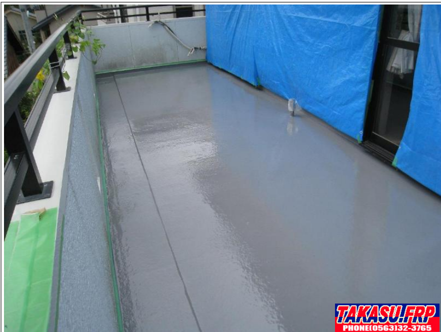
中塗り樹脂塗布 完了