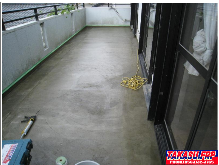
プライマー塗布 完了