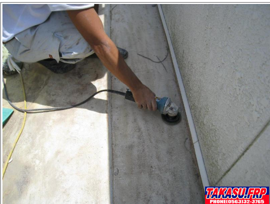
下地サンディング処理