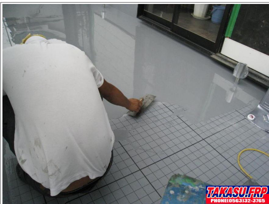
全面 ウレタン防水塗布