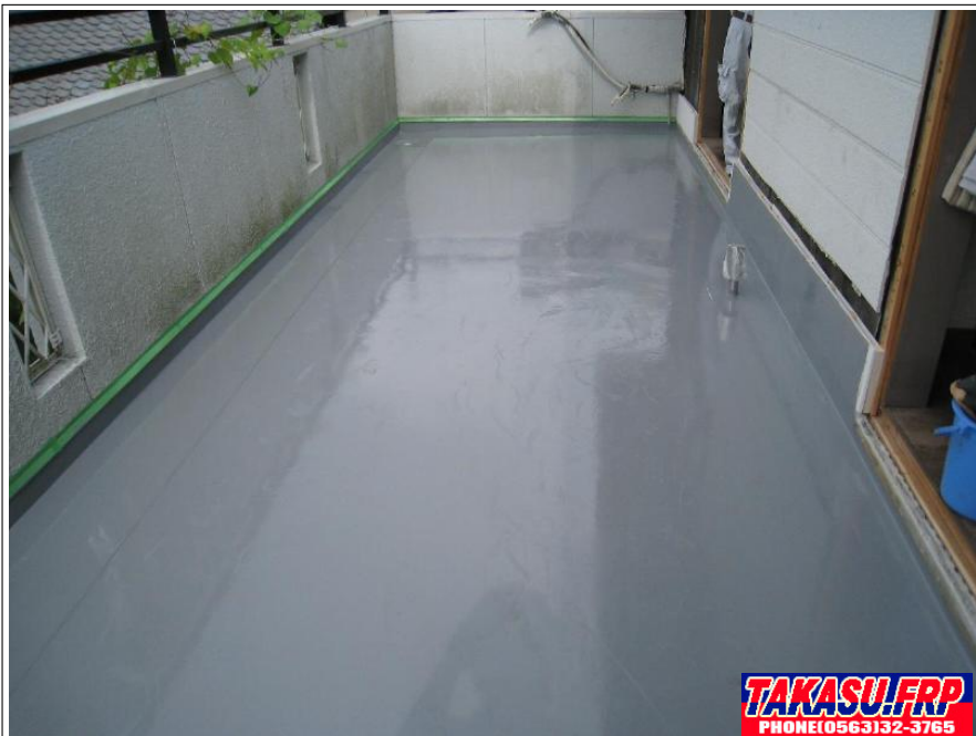
全面 ウレタン防水塗布 完了