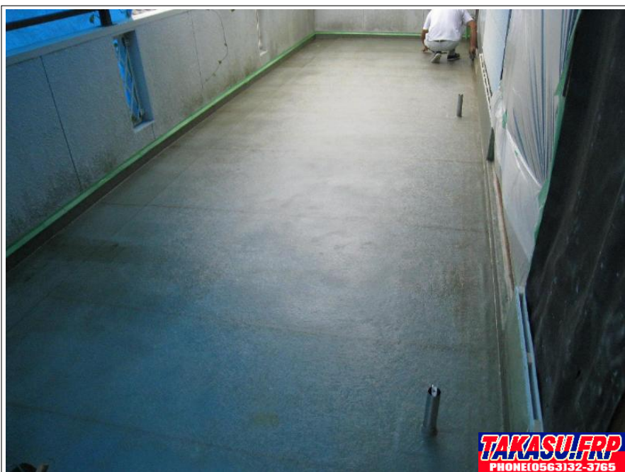
全面 FRP防水 完了