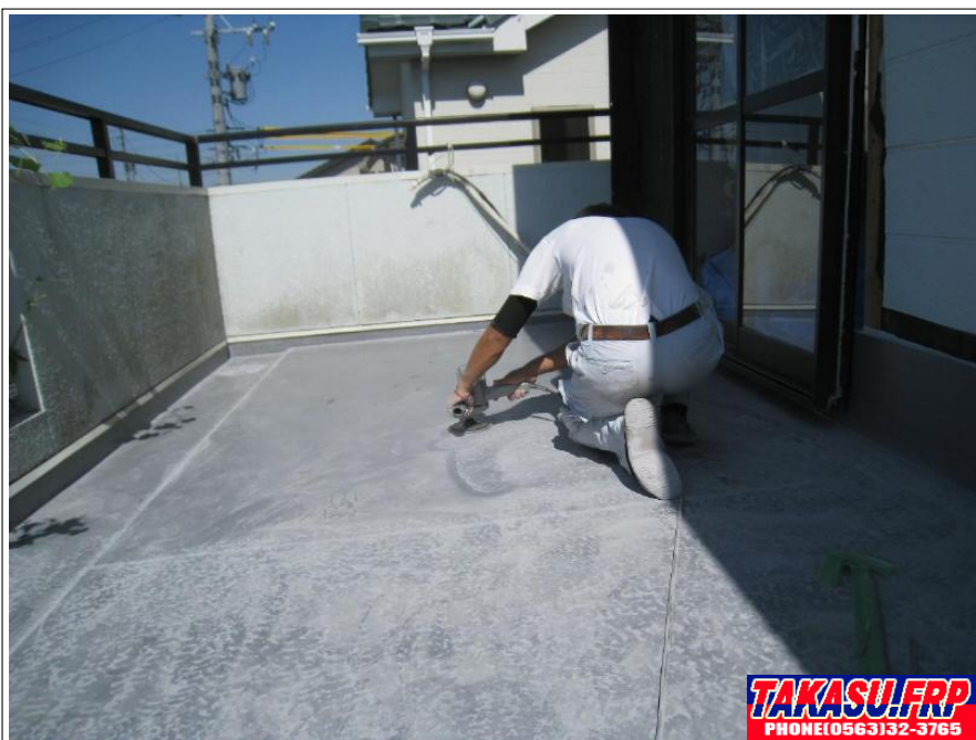
サンディング処理