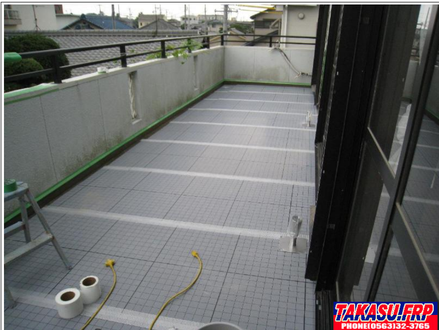
通気緩衝シート貼着 完了