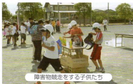
障害物競走をする子供たち