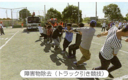
障害物除去 (トラック引き競技)