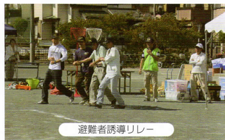
避難者誘導リレー