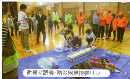
避難者誘導・防災器具持参リレー