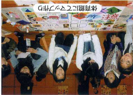
体育館にてスツツ作り