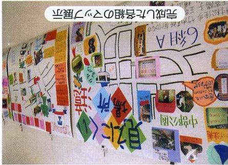
完成した各組のスツツ展示